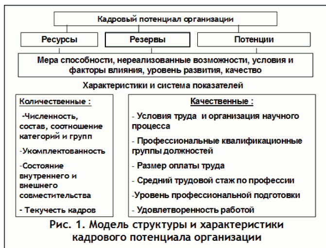
Рисунок 1 – Модель структуры и характеристики кадрового потенциала организации

Важной является и следующая формулировка, поясняющая, что «сущность кадрового потенциала состоит в том, что он является системным признаком и возникает в результате синергетических взаимодействий его составляющих» [там же]. Теперь «кадровый потенциал» – это признак, который возникает как синергетический эффект. И, тем не менее, авторы сохраняют и исходное понимание потенциала как «ресурсы, резервы, потенции» [там же]. Более того, на этих трех понятиях основана «модель структуры и характеристики кадрового потенциала организации»; в работе приводится соответствующая схема (см. Рис. 1).