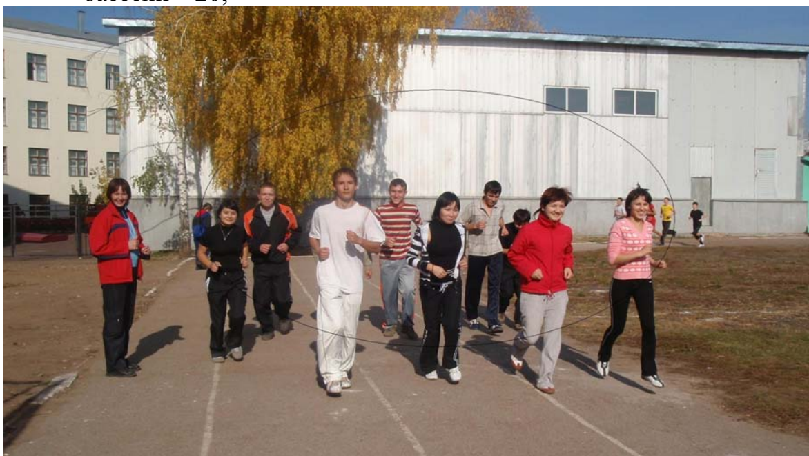
Рис.3 Занятия физической культурой на стадионе университета