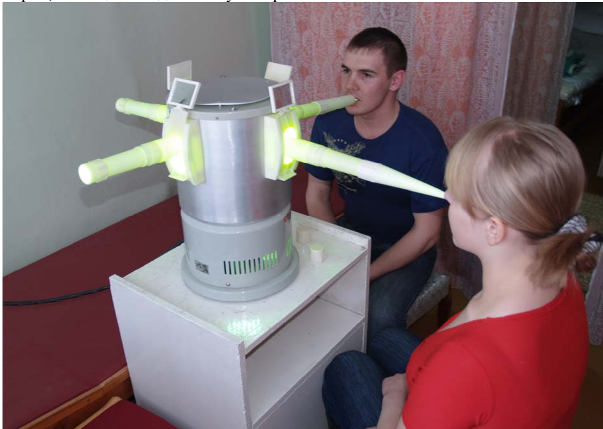
Рис.1 Профилактические медицинские мероприятия со студентами университета в врачебно-медицинском профилактории БГАУ

Программы повышения квалификации в области здоровьесбережения являются наиболее востребованными и актуальными среди работников БГАУ. Обучение проходит по технике безопасности и по вопросам охраны труда. Вопросы обеспечения безопасности жизнедеятельности экологии и др. рассматриваются на высоком научном уровне на конференциях, семинарах, совещаниях деканов университета.