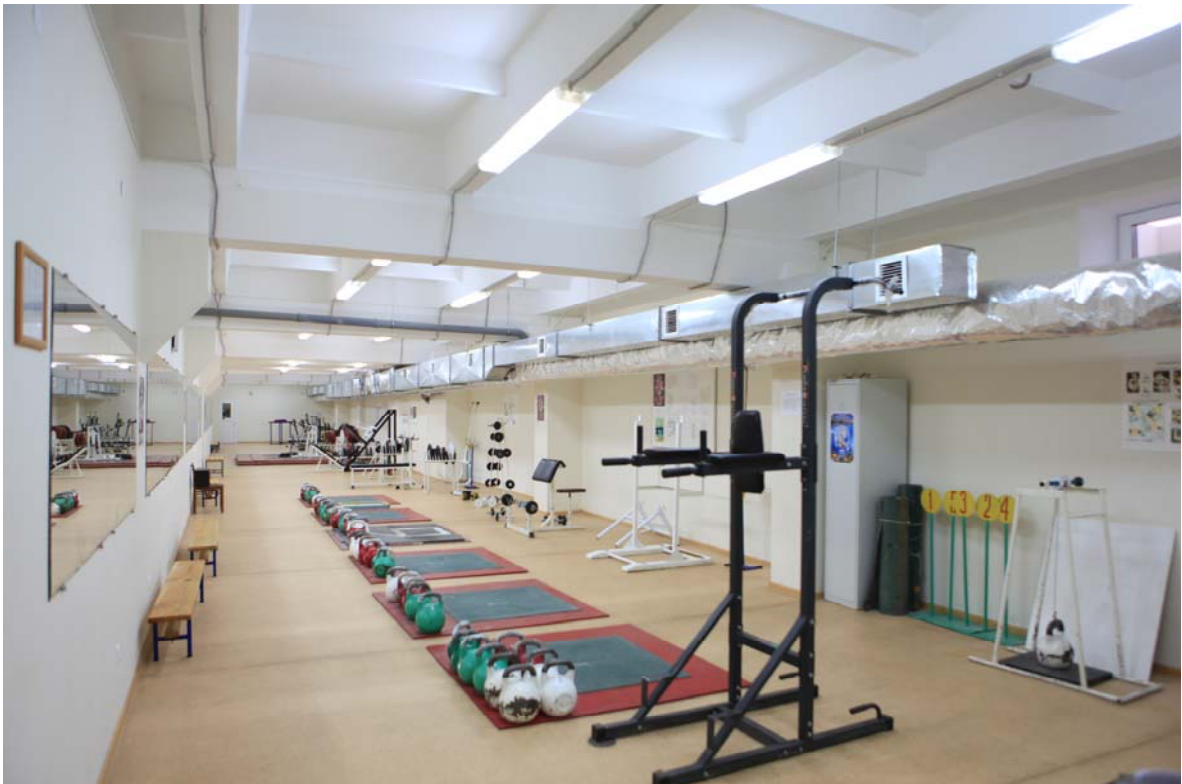
Рис.7 Тренажерный зал. Учебный корпус №2