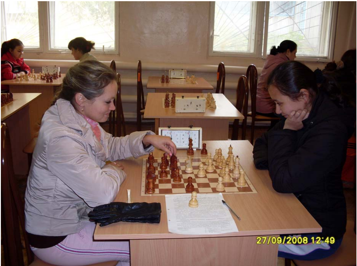
Рис. 4. Занятия в шахматном клубе БГАУ