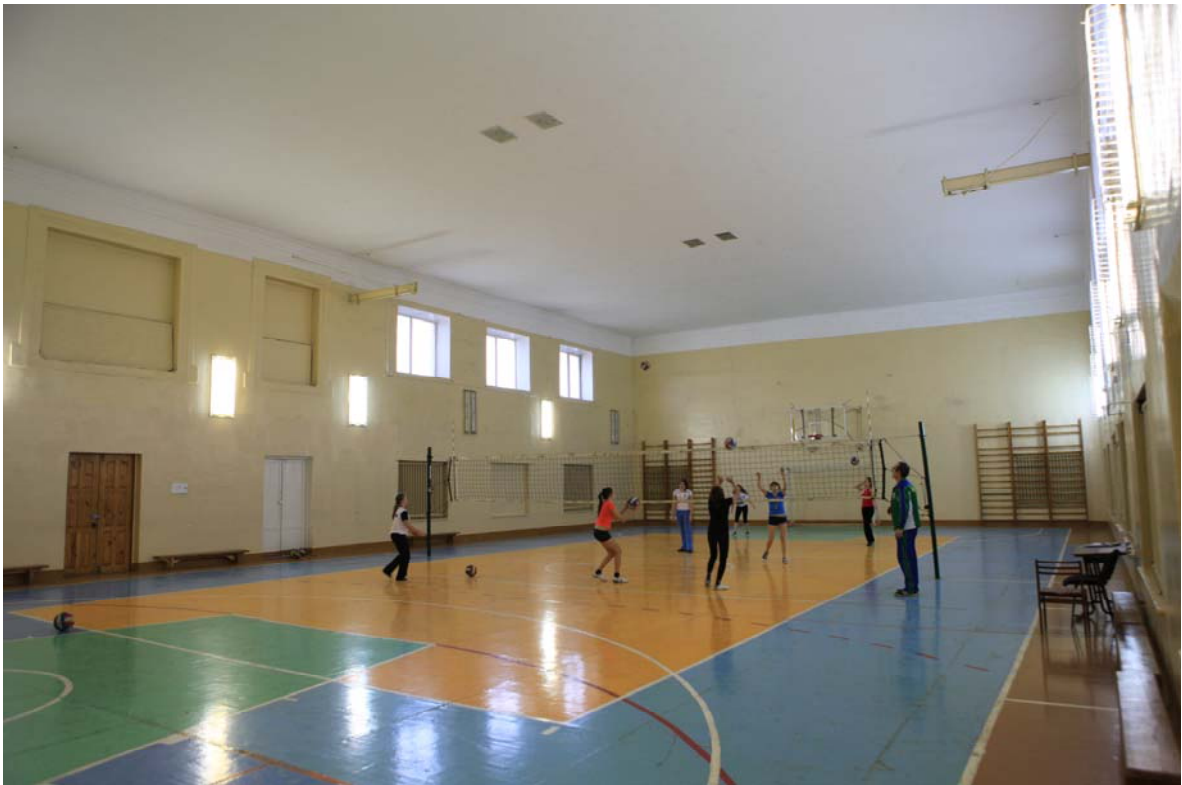
Рисб. Спортивный зал. Учебный корпус №1