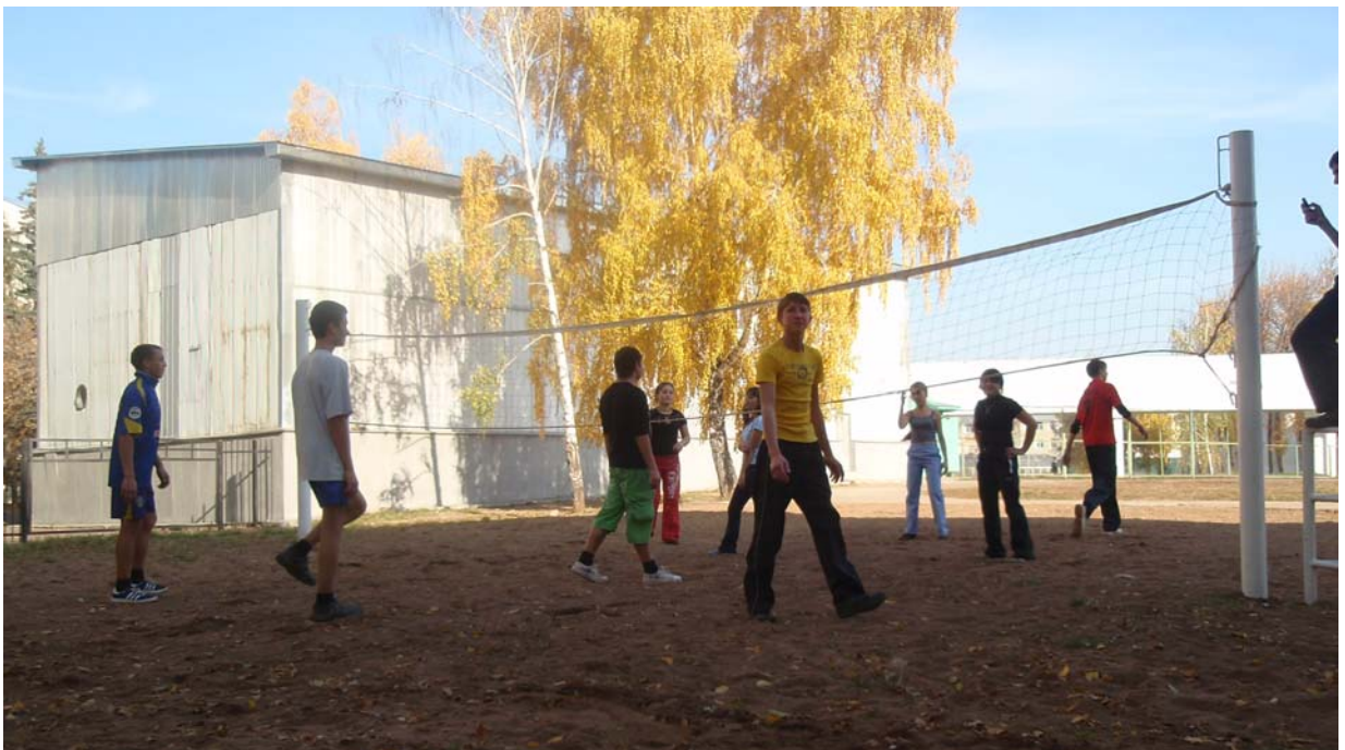
Рис.5 Занятия физической культурой на волейбольной площадке стадиона БГАУ