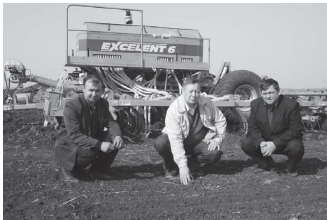
Внедрение прямого посева зерновых культур Илишевского района